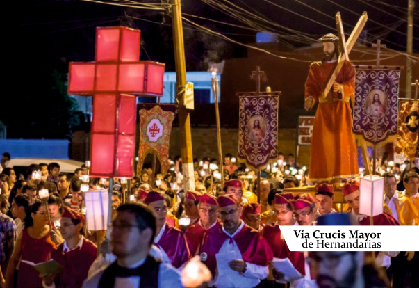
Vía Crucis Mayor de Hernandarias